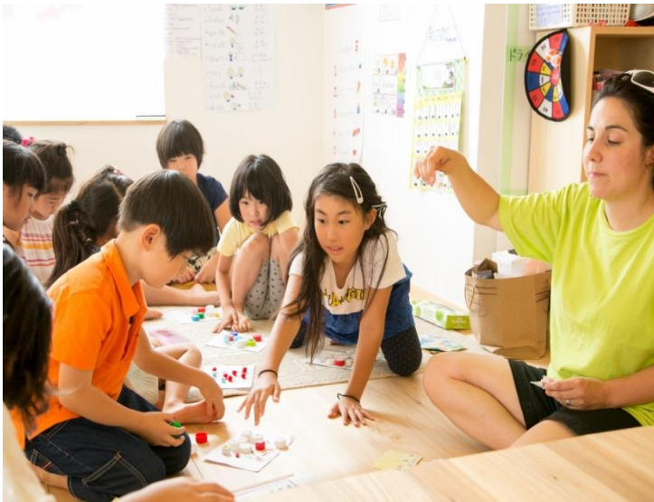
(いわきの学童保育施設「ドリームラボ」での様子)